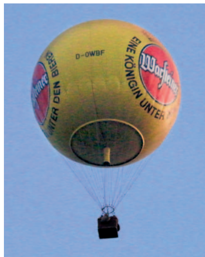
Die erste Schülergruppe hebt ab.

So werden neben den Ballonprojektwochen auch regelmäßig internationale Projektwochen etwa zu den Bereichen Fotografie/Mediendesign, Erinnerungsarbeit, Hauswirtschaft/Gastronomie und soziale Arbeit an-