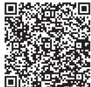
Zum Masterplan Berufliche Bildung

Das Ergebnis dieser ersten Überlegungen und Ansätze zur Konsolidierung der beruflichen Bildung ist der Entwurf zum Masterplan, der jetzt in die weitere Beratung geht. In den kommenden Monaten wird es weitere Gespräche in unterschiedlichen Formaten und Konstellationen geben.