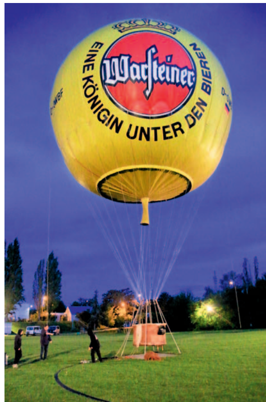
Gasballon, morgens um 05:30 Uhr kurz vor dem Start in Bitterfeld